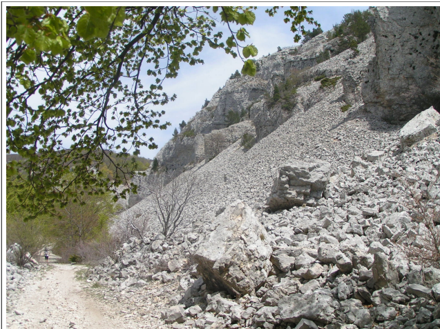
Les falaises de la Combe Fiole

Point de départ : le village de Sainte Colombe